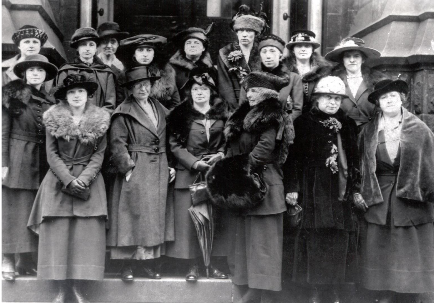
Delegates from the nine Charter Clubs who met in Buffalo, New York at the Statler Hotel on 8 November 1919